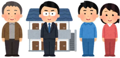
○居住支援法人の例

不動産事業者、見守りサービス運営会社、NPOや社会福祉法人などの法人格を持った事業者、福祉団体、介護事業者など、様々な分野の事業者が活動しています。 高齢者、障害者、ひとり親など、専門や得意分野がある事業者もいます。